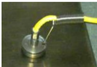
磁石表面 温度センサ