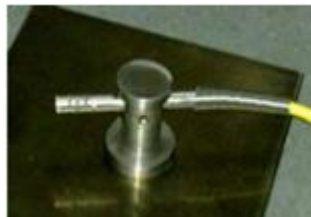
磁石気体 温度センサ