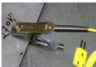
クリップ気体 温度センサ

特長: 断熱ボックスにより+850°Cまでの高温下で連続 80 分の使用に対応。同時に 4ヶ所の温度測定がおこなえます。