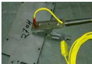
クリップ表面 温度センサ