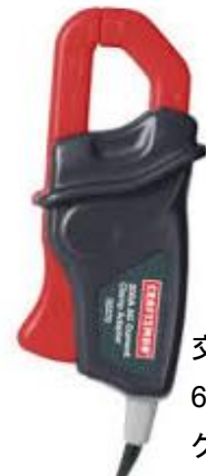
交流電流 600V/200A 対応 クランプ

EL-USB-ACT は、消費電力量を表示できる交流電流データロガーです。EL-USB-ATC の測定モードには電流モード、消費電力量モニタリングモード、直流 mV モードの 3 種類を選択できます。